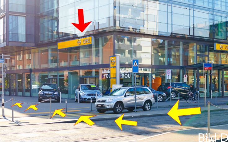
Bei Haltestelle „Freihofstrasse“ Fussgängerstreifen in Richtung Opel-Glasgebäude überqueren.