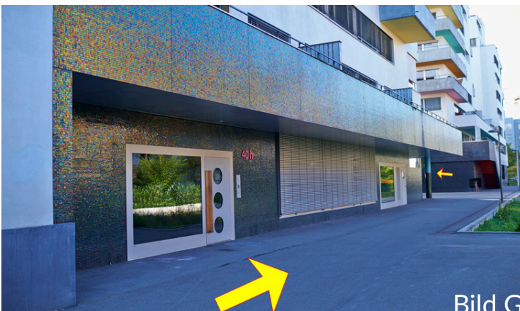
dann unten vor Eckgebäude links in asphaltierten Innenhof entlang Langhaus (L) zum Atelier gehen.