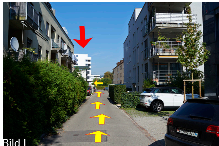
Flüelastrasse (von Badenerstr. her), wo ca. in der Mitte der James-Park beginnt (L) und vis à vis ist der offizielle Besucherparkplatz