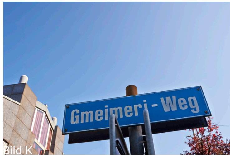
Das hinter einer Hecke versteckte Wegschild. Der Weg führt diesem Gebäude entlang.