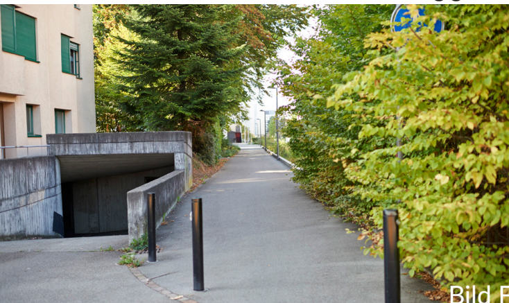
Versteckter Fussweg Höhe Edelweisstrasse