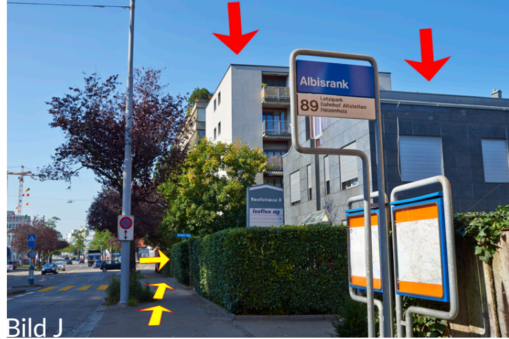
Bushaltestelle „Albisrank“ Seite Gmeimeriweg, den man vom Trottoir her durch eine Hecke nehmen muss